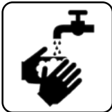
SPĂLARE FRECVENTĂ PE MĂINI CU APĂ ȘI SĂPUN