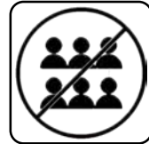
EVITAREA SPAȚIILOR AGLOMERATE