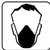
UTILIZAREA MĂȘTII DE PROTECȚIE