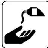
DEZINFECTARE PE MĂINI